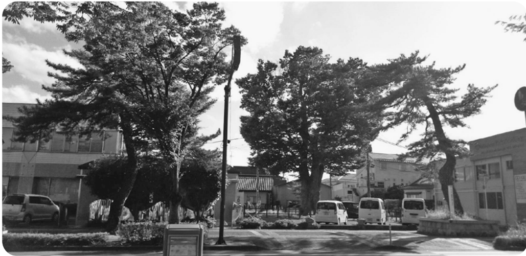
所在地 / 伊達市保原町字宮下111-4