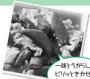
一味とうがらしをピリッときかせて眠気もスッキリ!