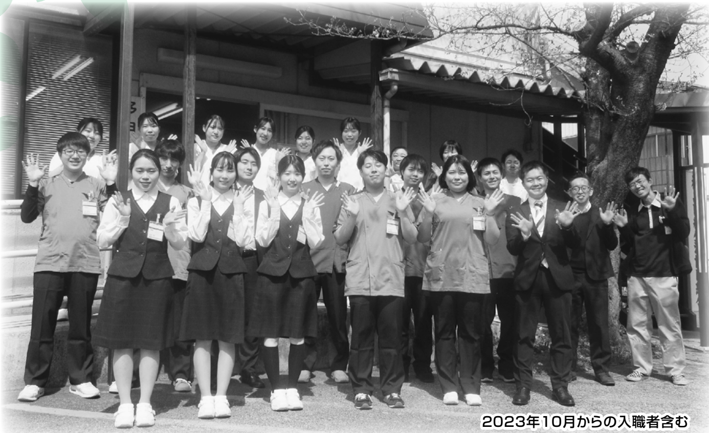
2023年10月からの入職者含む

福島医療生活協同組合 TEL 024-522-1236 〒960-8141 福島市渡利字中江町66 医療生協わたり病院 TEL 024-521-2056 〒960-8141 福島市渡利字中江町34 生協いいの診療所 TEL 024-562-4120 〒960-1301 福島市飯野町字後川27-2 医療生協わたり病院附属 ふれあいクリニックさくらみず TEL 024-559-2664 〒960-0241 福島市笹谷字塗谷地20-1