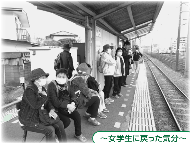
~女学生に戻った気分~